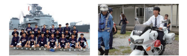
課外授業等で海上自衛隊艦船「ゆうだち」体験乗船や、警察署、消防署のイベント等に参加することで、その仕事に対する理解を深めていきます。