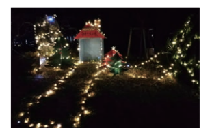
毎年恒例のTECグループ生徒によるイルミネーション