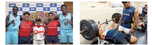
様々な国から来た留学生たちは互いに刺激し合い、全国に通用するチーム作りに大いに貢献しています。さらに高みを求め、実業団やプロで活躍する選手も多くいます。