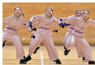
高校課程では看護学科生も部活動に取り組み、他の普通科生徒と共に大会に出場するなど、大活躍しています。

また、高校課程では、普通科の生徒と共に学校行事や部活動にも参加するため、協調性を高めることもできます。本校の看護学科は、60年の歴史を持ちこれからも看護師として人に寄り添うために「豊かな人間性」と医療の進歩や社会の変化に対応していくために「生涯学び続ける力」を育みます。