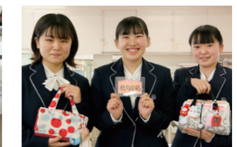
先生方からいただいたお守りを手に全員の国家試験合格を目指します！