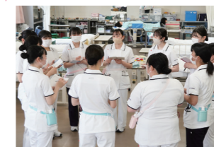
子どもに合わせた健康管理の大切さを伝える方法など自分たちで考え、実践し学んでいます。