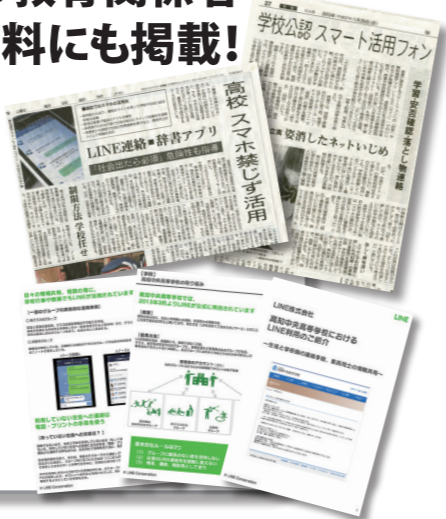
左上記事:朝日新聞【2014年5月17日掲載】 右上記事:毎日新聞【2015年1月25日掲載】 下:LINE(株)講演資料「高知中央高等学校におけるLINE利用のご紹介」

2013年3月よりスタートした日本初のLINE活用の取り組みが、全国のあらゆるメディアから注目を集めその活動実績は高く評価され、全国の大学や国公立中高から「参考にしたい」と講演依頼も殺到! LINE本社のマニュアルにも例題に挙げられるほど、本校のLINE利用実績は「学校教育とSNSの融合」の先駆的存在となっています。